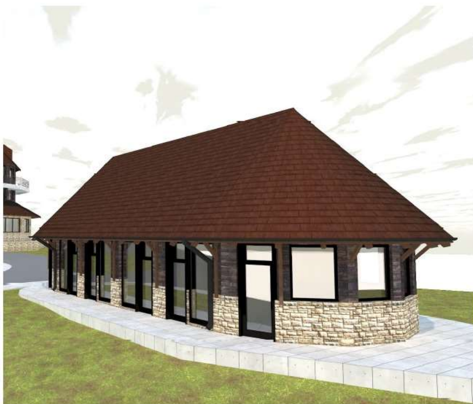
сл.3 Идејно решење Туристичко-визиторског центра Растоке-Увац, објекат 2, сувенирнице

Увид и ближе информације о објектима и пројекту могу се добити у Одељењу за инвестиције и јавне набавке Општинске управе Нова Варош, Карађорђева 32, канцеларија