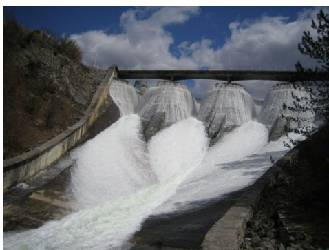
Брана на Златарском језеру

Специјални резерват „Увац“ је заштићено природно добро од изузетног значаја. Централну морфолошку целину резервата представља кањонска долина реке Увац са долином њених притока. Јединствени загрљај природе, прожимање воде и копна које их окружује, кратак је опис три прелепа језера: Увачког, Златарког и Радоињског. Настала су делимичним потапањем долине моћне планинске реке Увац и изградњом три бране.