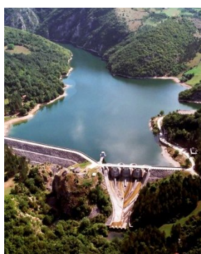
Брана на Радоињском језеру