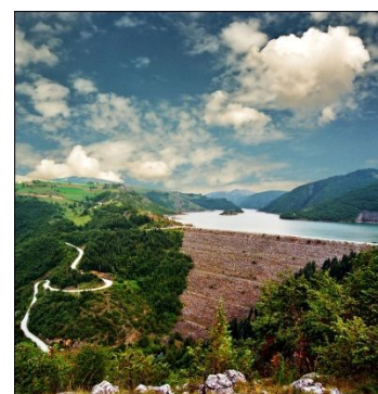
Брана на Увачком језеру

Специјални резерват природе „Увац,, богат је скаршћеним површинама у којима су бројни крашки облици: крашке површи, увале, вртаче, окапине, прерасти, пећине и јаме. Посебна вредност кањонских делова долине су укљештени меандри чији ртови имају релативну висину и до 100m. Лепота речима неизрецива, само позив и савет – стати, па гледати! Пећине су бројне и по величини варирају од поткапина до највећег до сада познатог пећинског система у Србији, Ушачког пећинског система (6.185m).