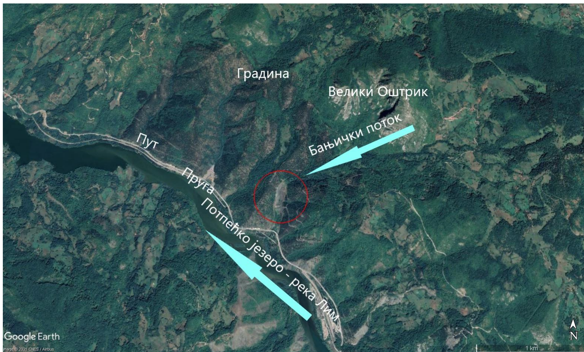
Слика 2 Локација РЦУО „Бањица“ и садашња несанитарна депонија